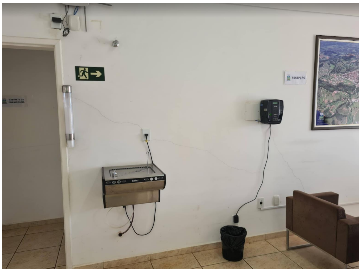
Figura 13 - Trincas.