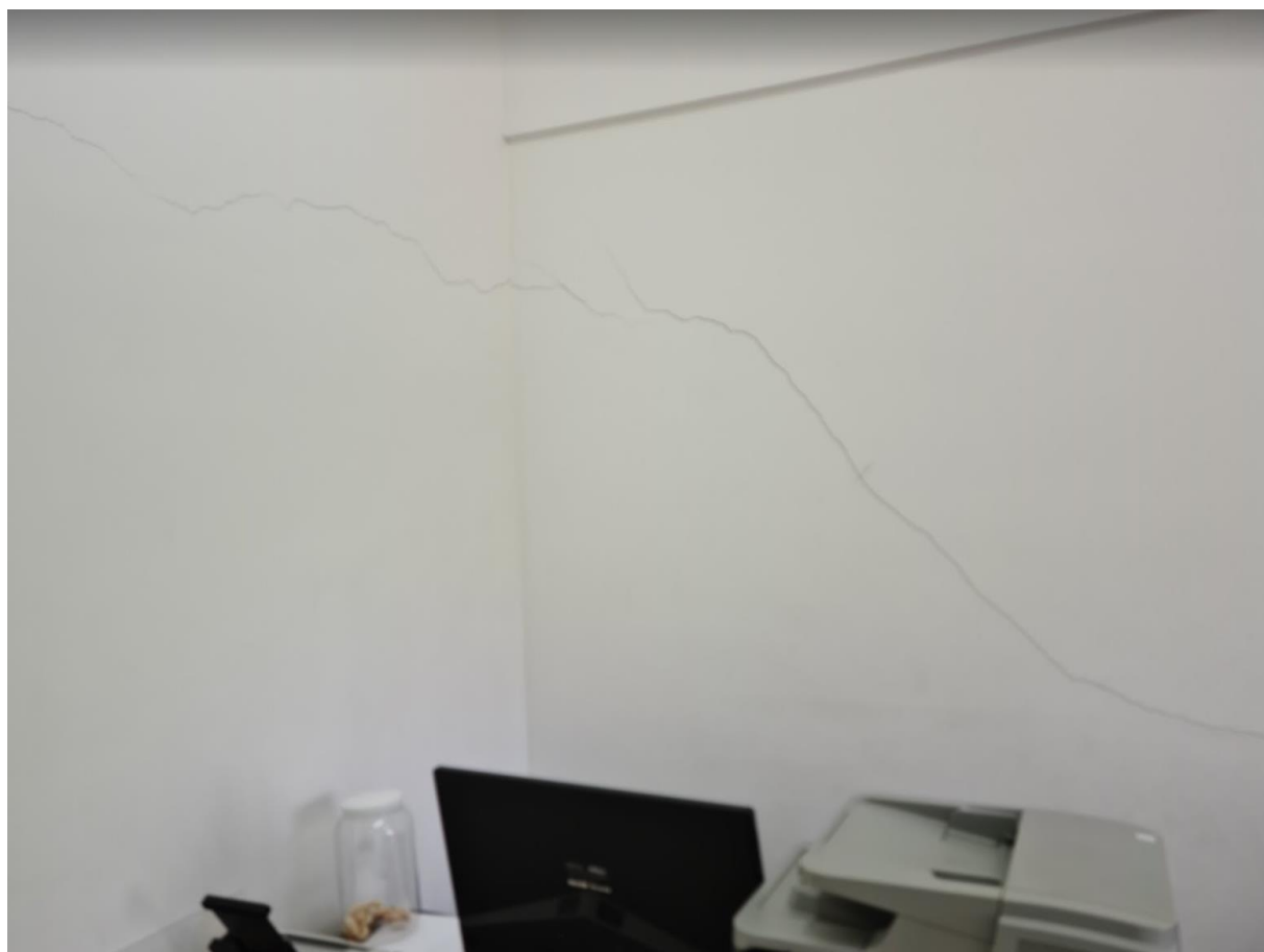
Figura 12 - Trincas terceiro pavimento.