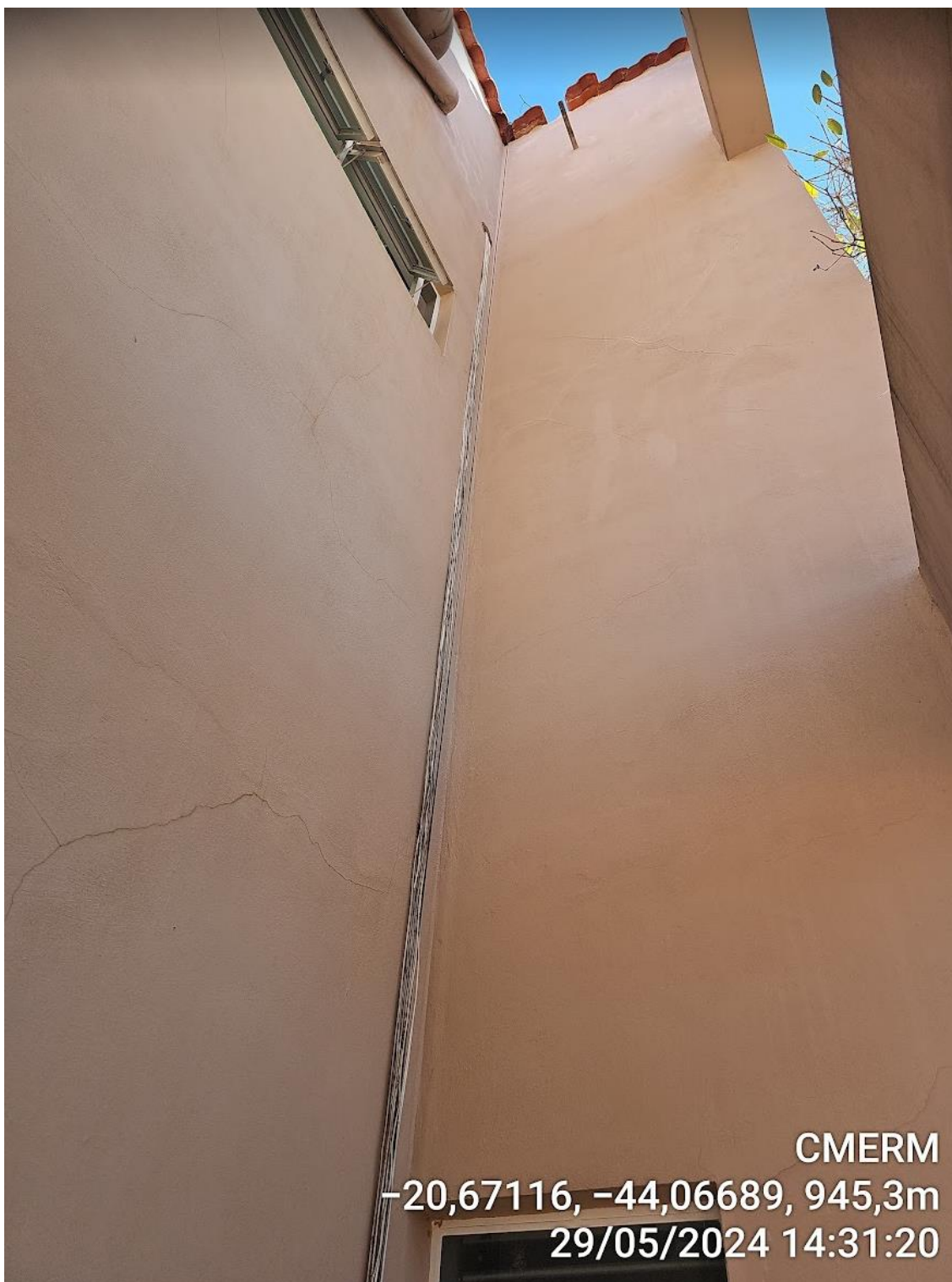
Figura 18 - Local de instalação da escada para acesso ao telhado.