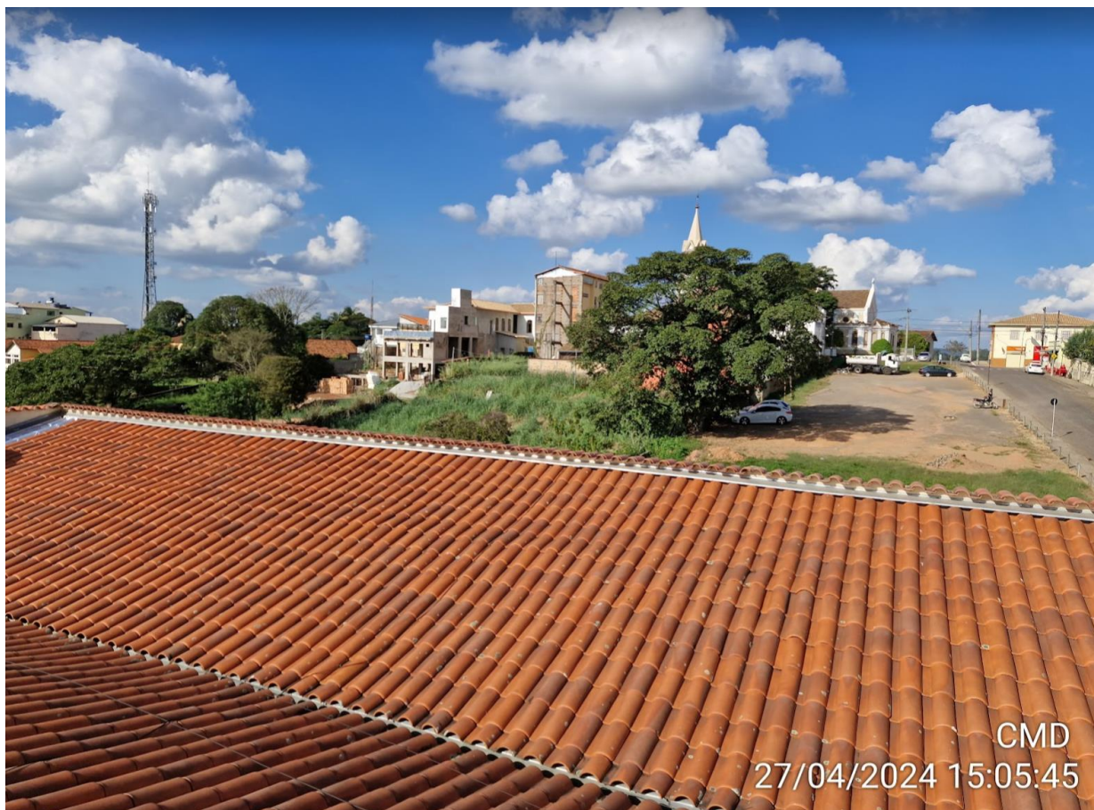
Figura 4 - Visão geral do telhado.