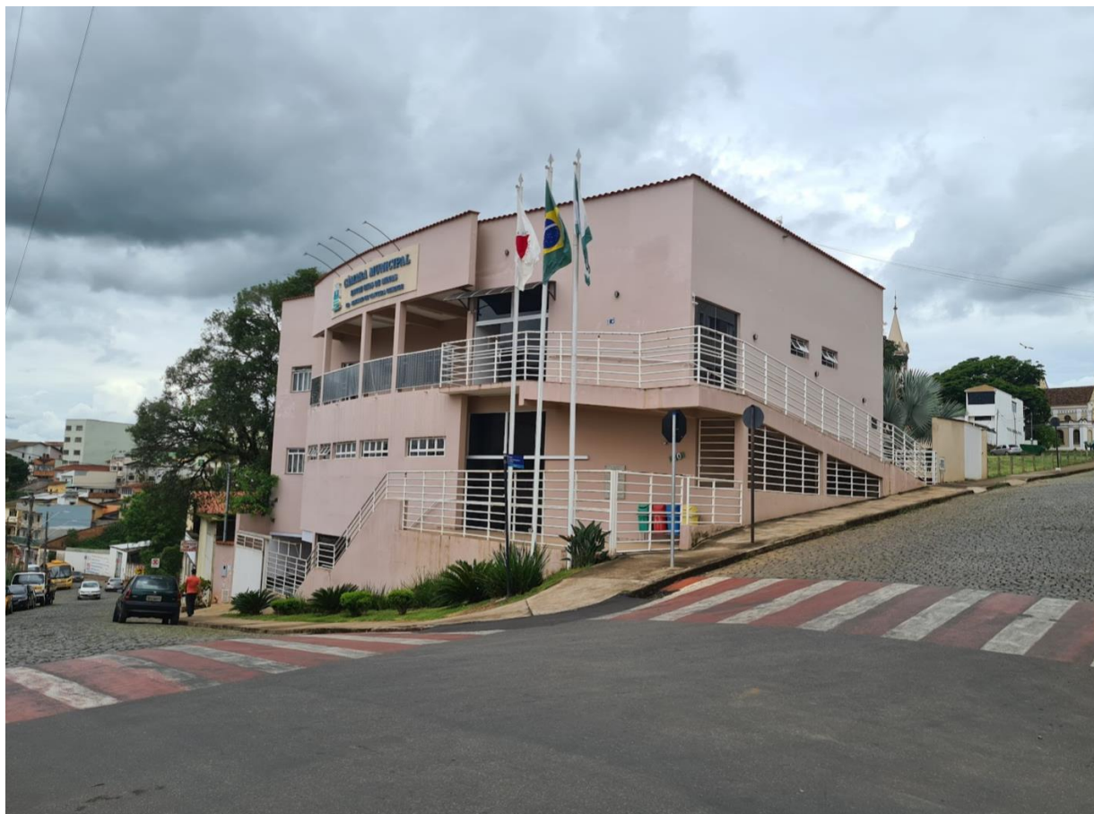
Figura 1 - Prédio da Câmara Municipal de Entre Rios de Minas