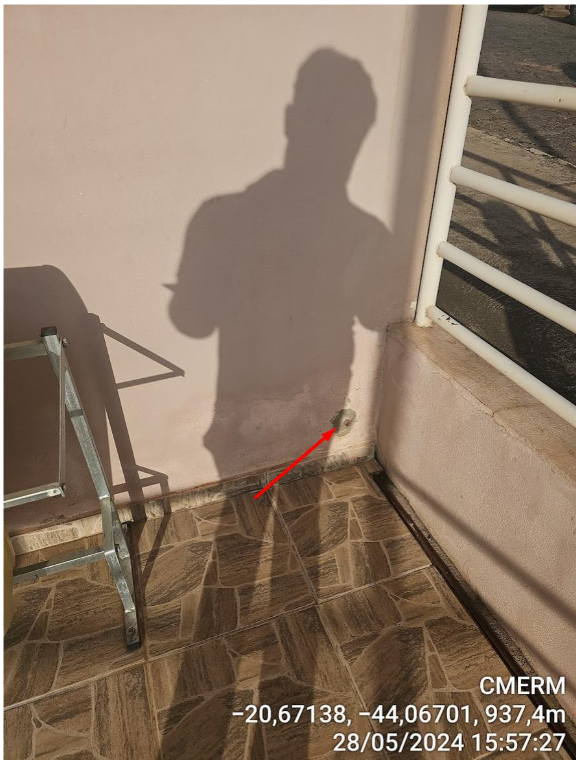
Figura 20 - Drenagem insuficiente na parte abaixo da rampa que dá acesso ao terceiro pavimento.