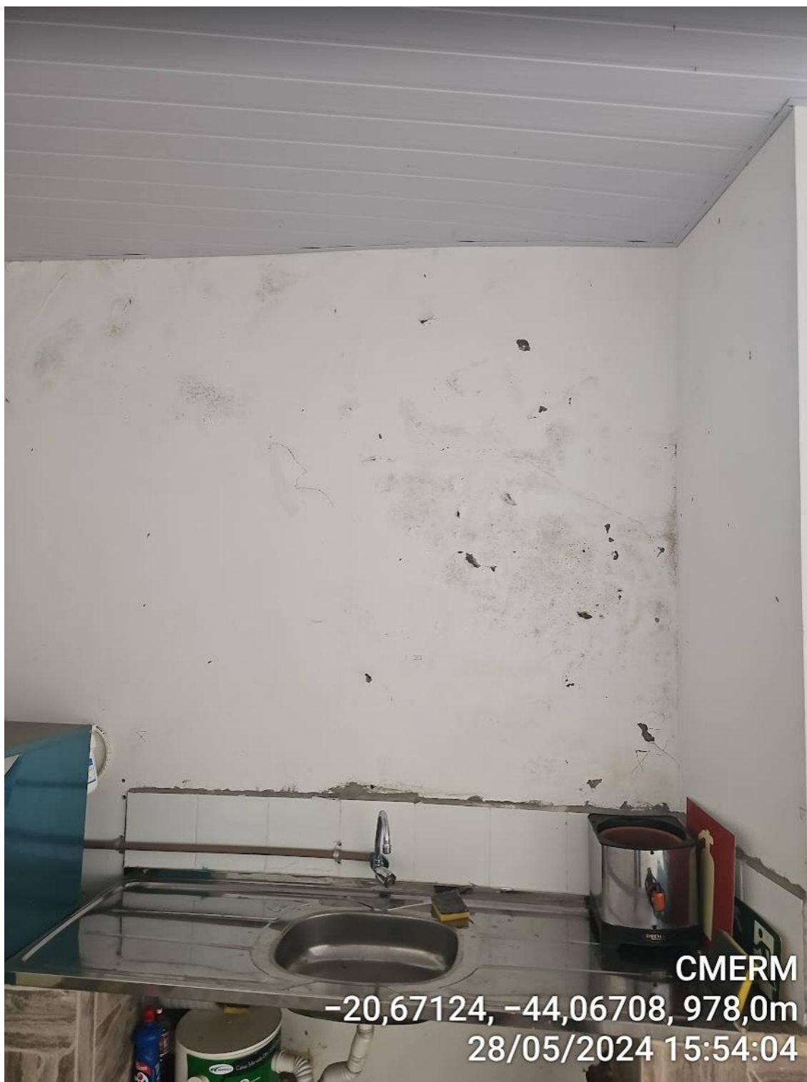
Figura 17 - Infiltração no primeiro pavimento.