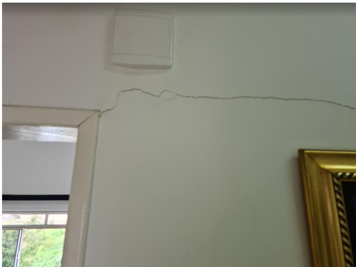
Figura 9 – Trincas no corredor do terceiro pavimento.