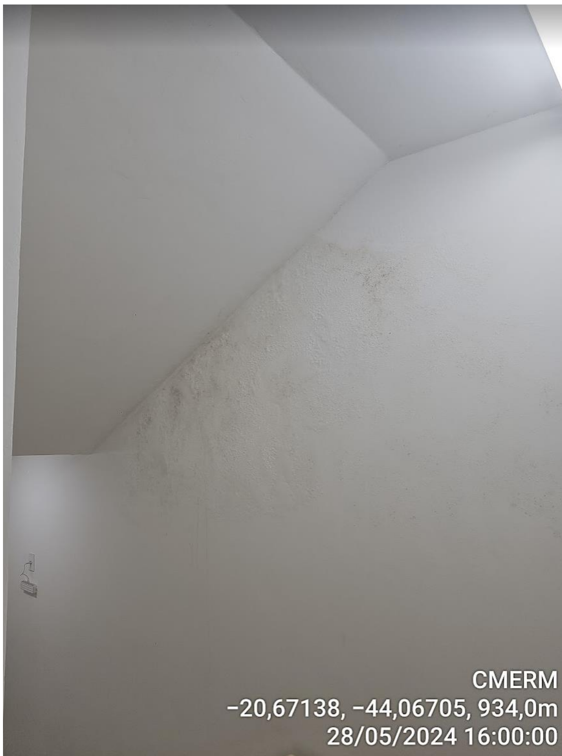
Figura 16 - Infiltrações na escada entre o 1º e 2º pavimento.