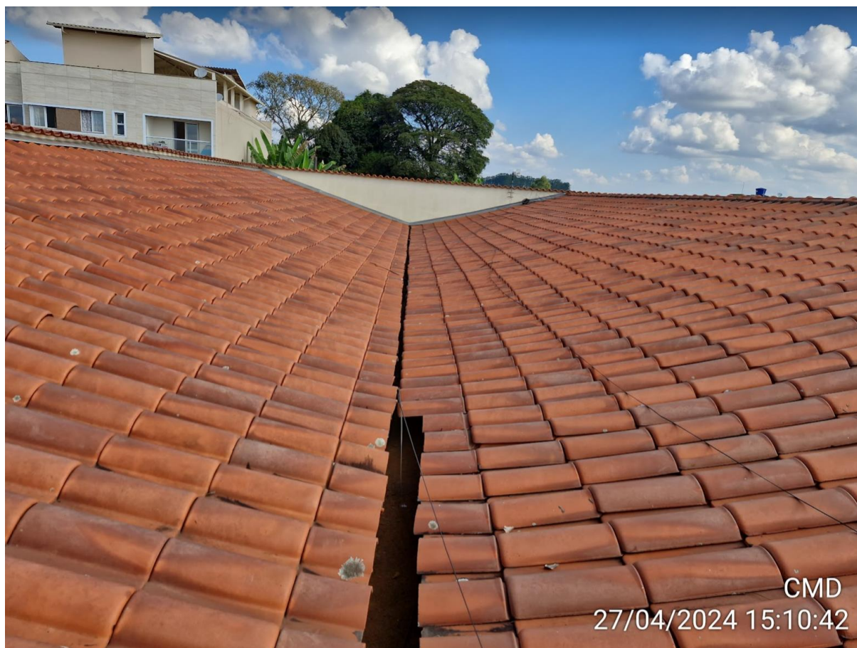
Figura 2 - Visão do telhado.