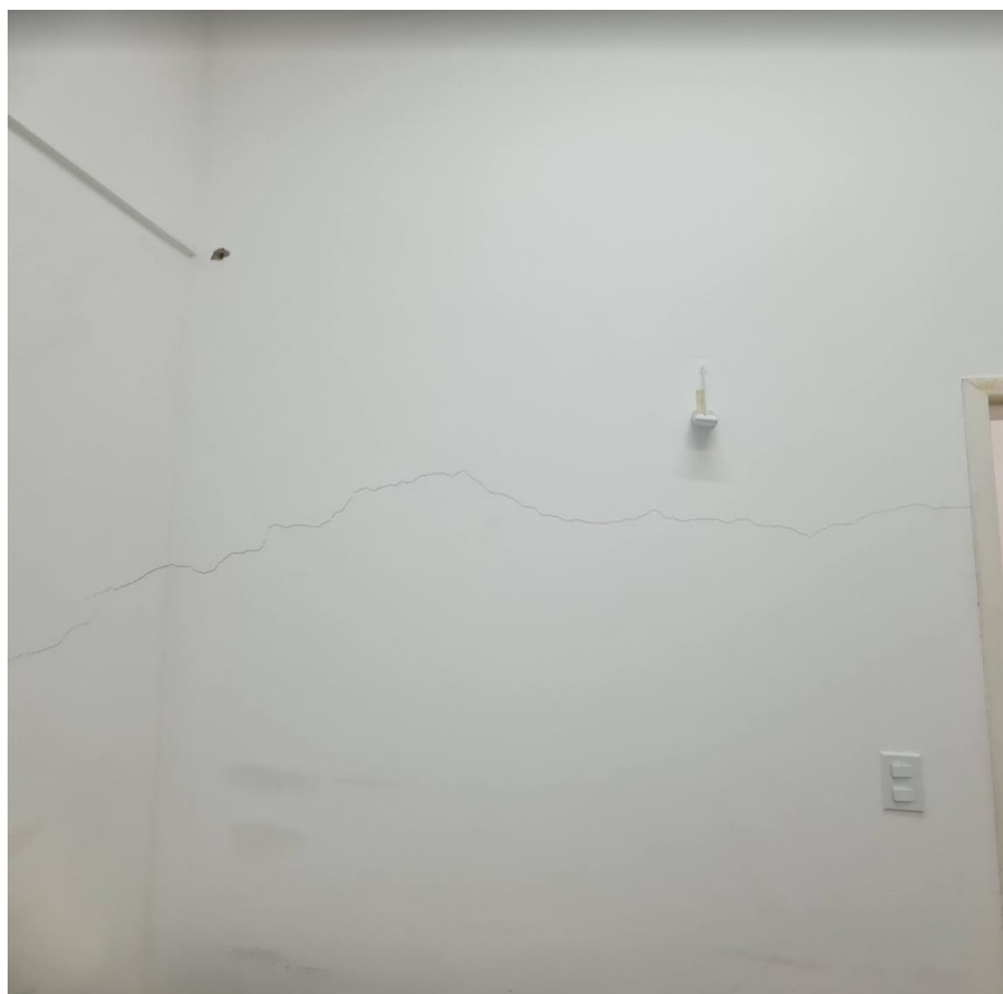
Figura 11 - Trincas terceiro pavimento.