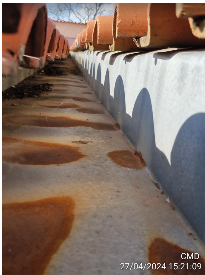
Figura 7 - Situação das calhas.