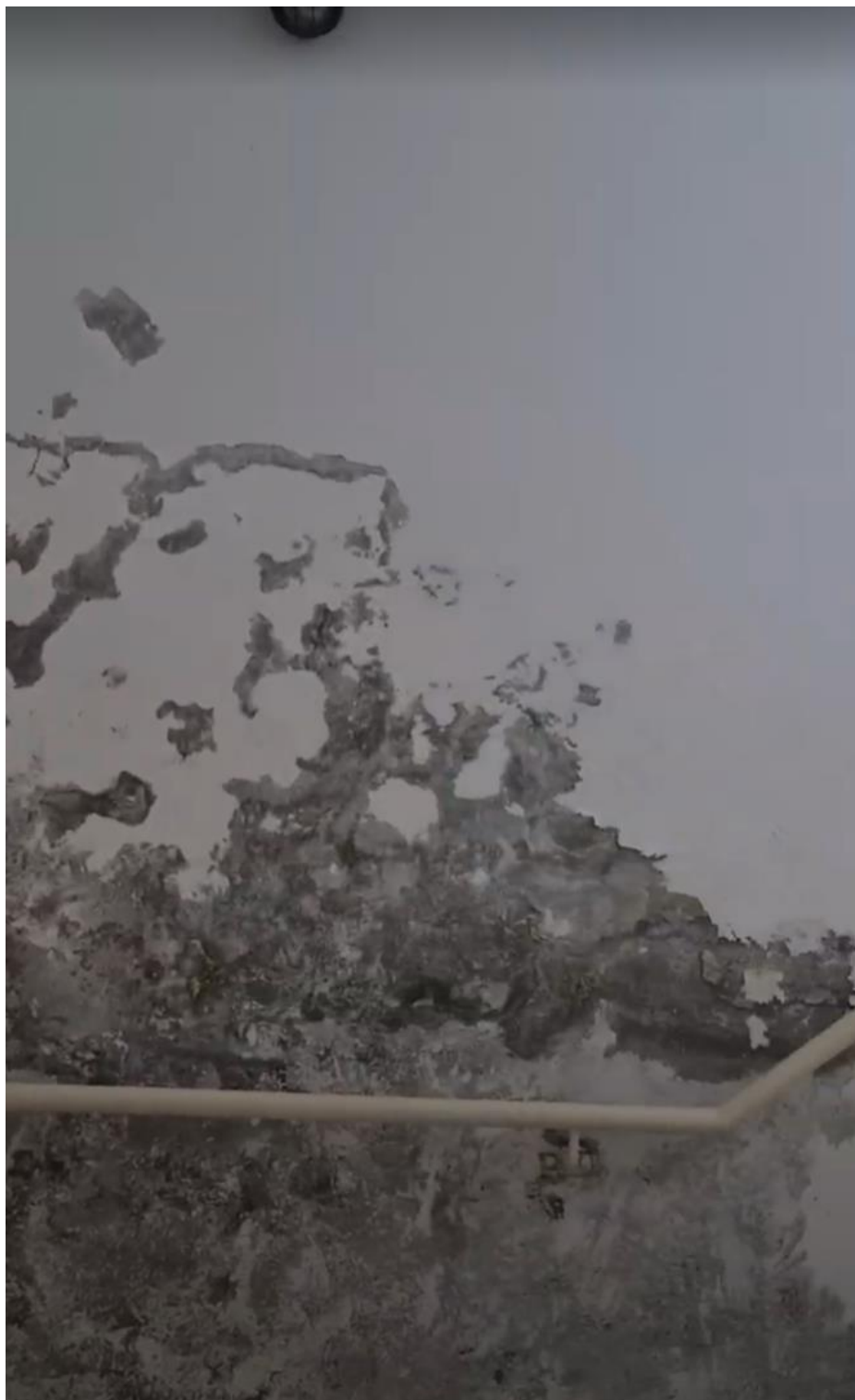
Figura 14 - Infiltrações na escada entre o 2º e 3º pavimento.