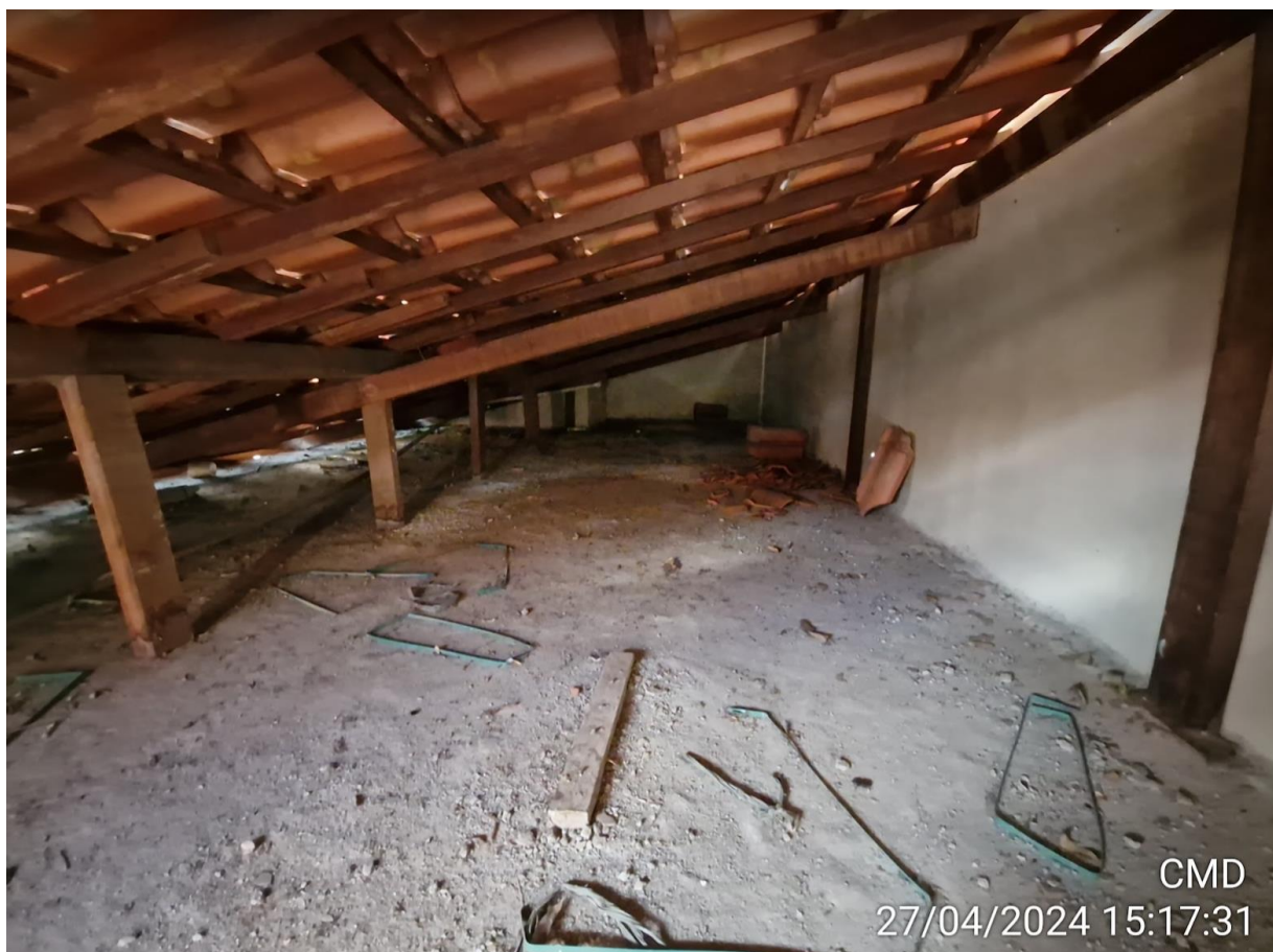
Figura 5 - Visão da parte superior da laje.