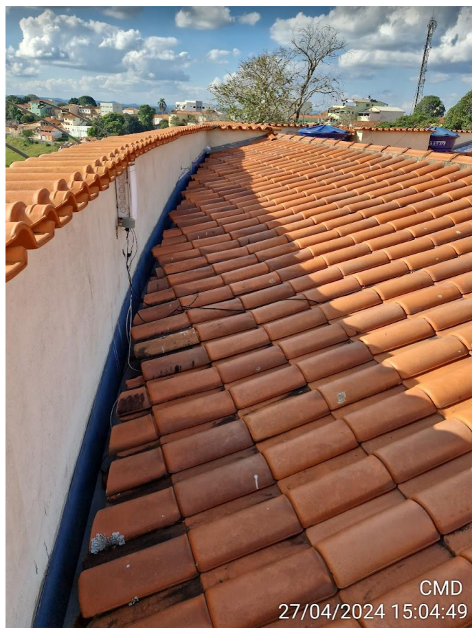
Figura 6 - Telhado sob a varanda.