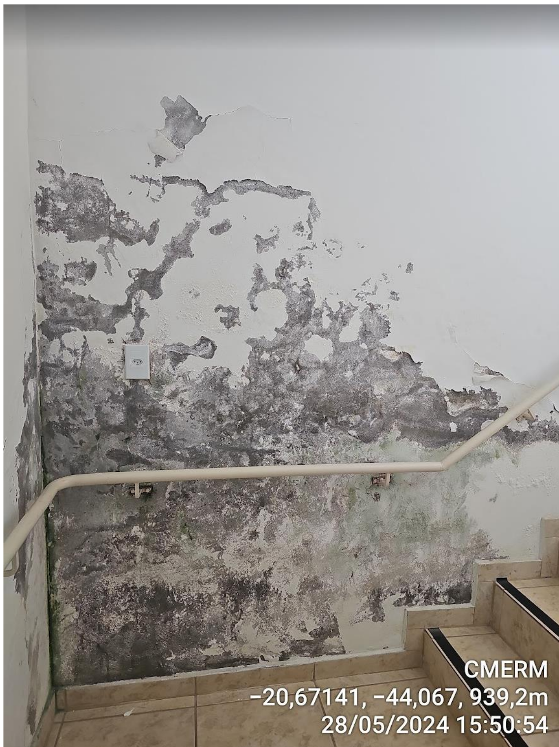
Figura 15 - Infiltrações na escada entre o 2º e 3º pavimento.