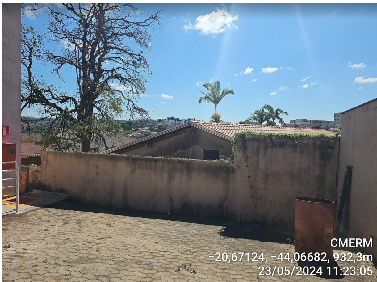
Figura 19 - Muro onde deve ser instalada a pingadeira.