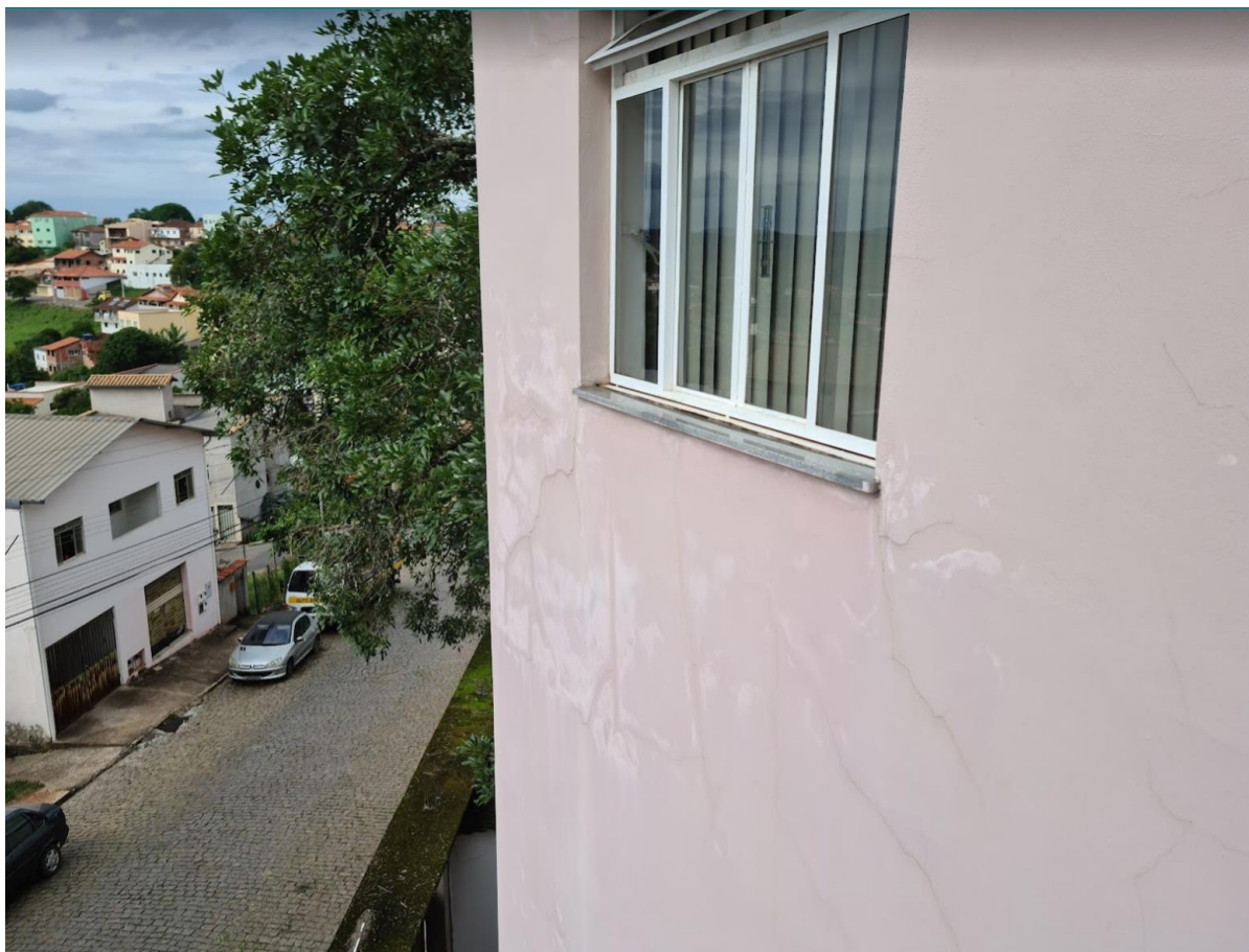
Figura 8 - Fissuras na área externa do prédio.